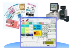
(券作くんタッチパネル販売画面)

チケット発券、精算管理、売上集計を行うチケット発券に特化したPOSシステムです。引換券の出力やPOSキット連携にも対応します。