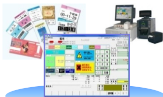
(券作くんタッチパネル販売画面)

チケット発券、精算管理、売上集計を行うチケット発券に特化したPOSシステムです。引換券の出力やPOSキット連携にも対応します。