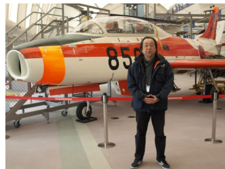
多数の実機を間近に見学できます

年に数回、実際に使用されていた実機の部品や旅客機で使用されていた備品などの即売会をおこなう所沢航空ジャンク市や特別展を開催しています。いずれの催しでも、移動可能な券作くん端末を会場に設置して商品販売管理に活用しています。チケット発行システムとしての役割だけではなく、バーコードリーダーで商品に貼りつけたJANコードをスキャンするだけで物販POSとして商品の販売管理にフル活用させてもらっています。