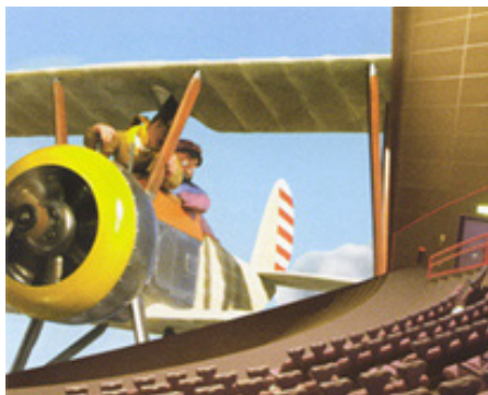
迫力ある映像が楽しめる大型映像館