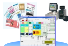
(券作くんタッチパネル販売画面)

チケット発券、精算管理、売上集計を行うチケット発券に特化したPOSシステムです。引換券の出力やPOSキット連携にも対応します。