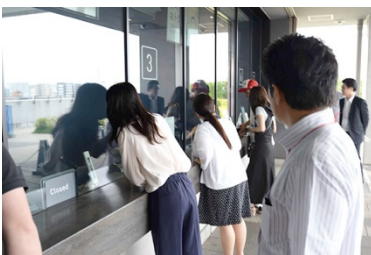
▲すみだ水族館チケット窓口