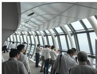
▲東京スカイツリー展望台

* 記事掲載予定 * ユーザー会の内容は 総合ユニコム株式会社から出版される 業界紙「月刊レジャー産業資料」に 掲載される予定です。